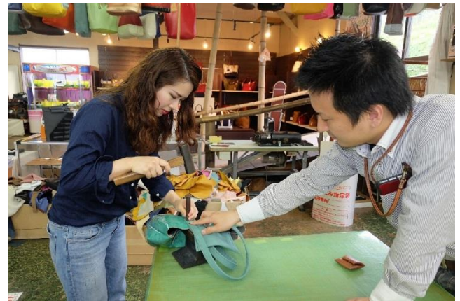
本体に取手を打ち付ける。