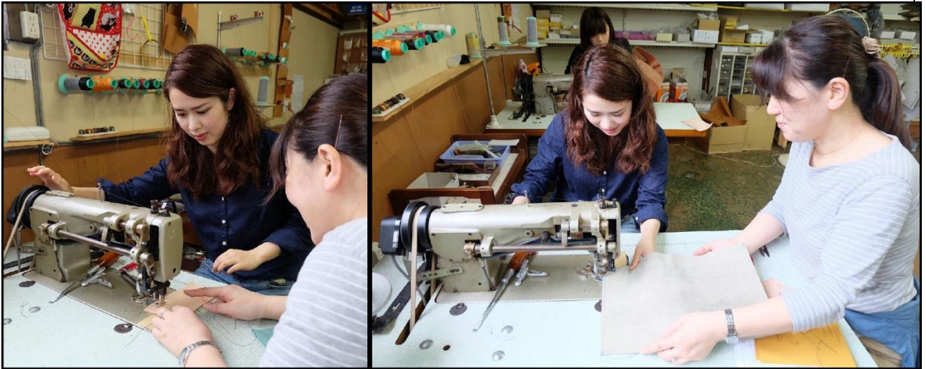
工業用ミシンの使い、裁断したパーツを縫製する。