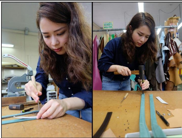
取手に印を付け、ポンチで穴をあける。