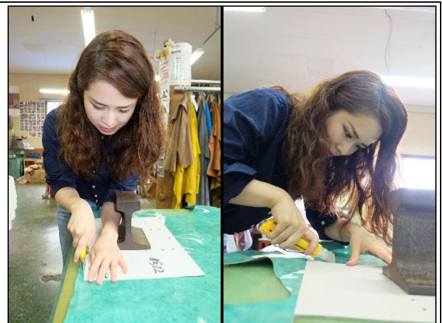
型紙に合わせて革を裁断。