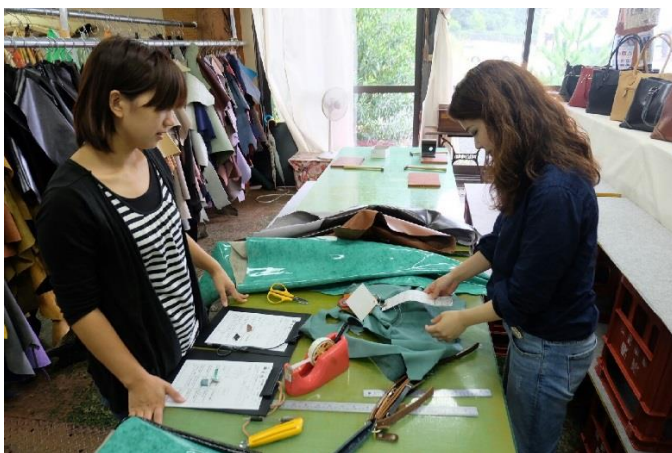
バッグのデザイン、糸の色、ロゴ等を打ち合わせする。