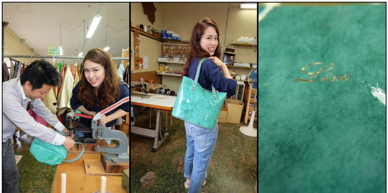
ホックを付けて完成