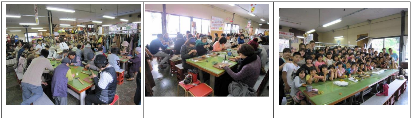
介護施設 (リハビリ)